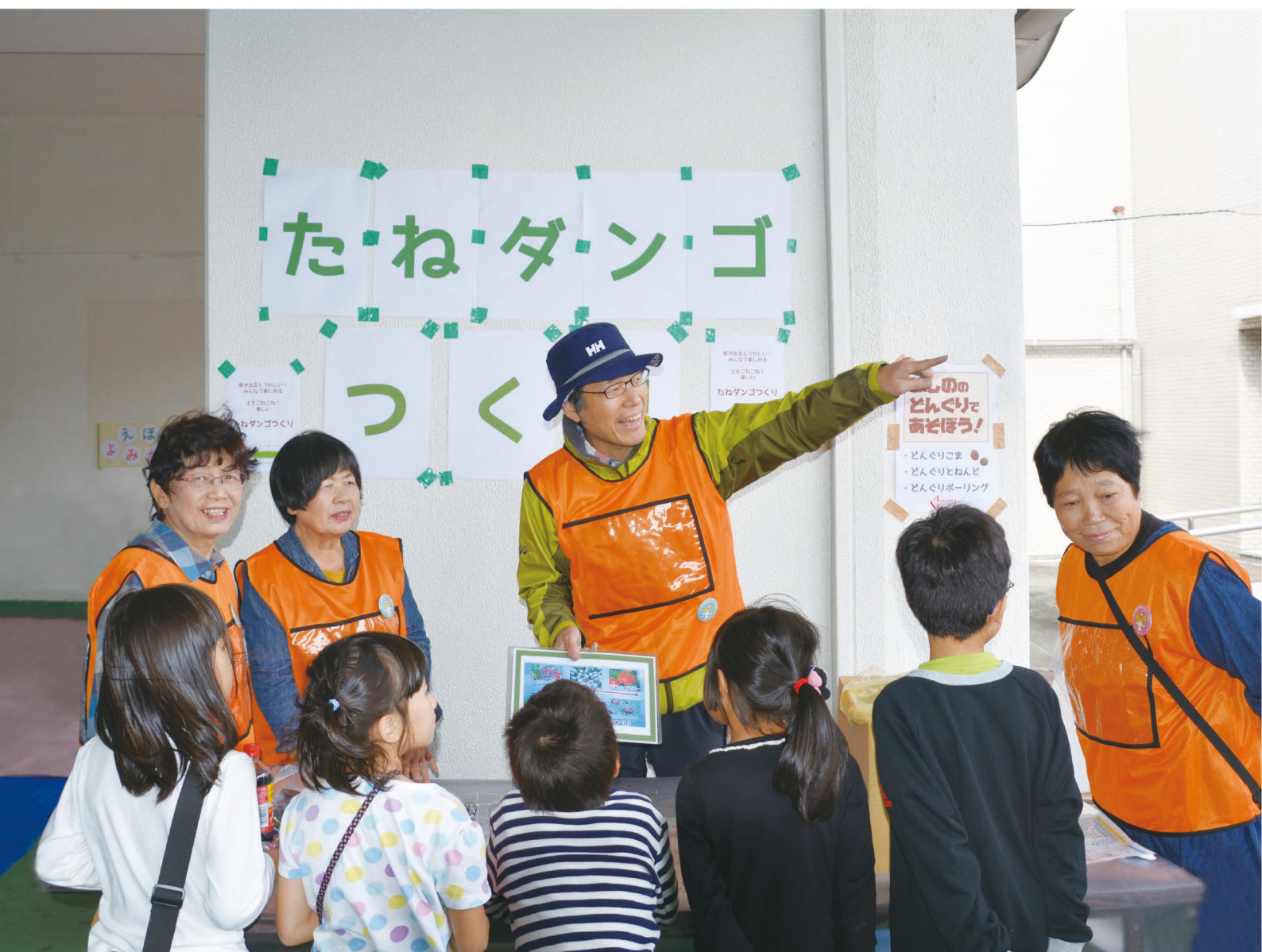
みんなの会わいわいフェスティバル (菱野団地)