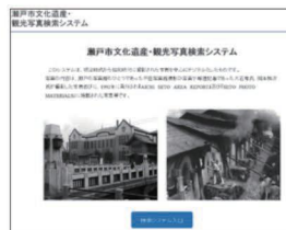
写真検索システム