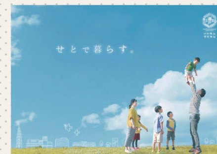
本市の定住促進に向けたパンフレット「せとで暮らす。」

4つの分野を施策の柱とし、 将来像 「住みたいまち 誇れるまち 新しいせと」 の実現を目指します。