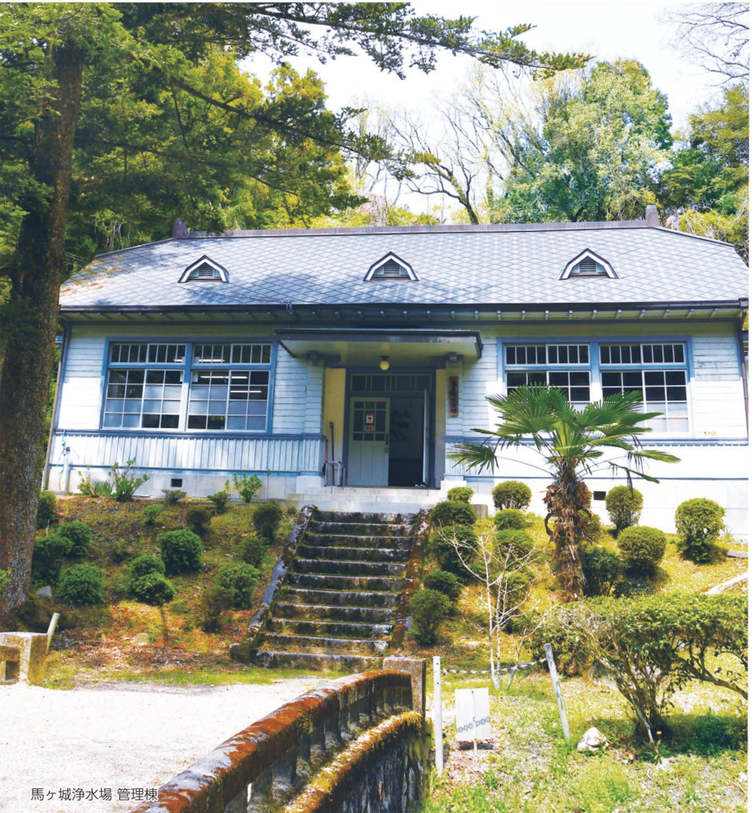
馬ヶ城浄水場 管理棟