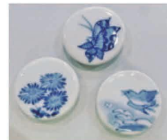
景品のイメージ(染付マグネット)