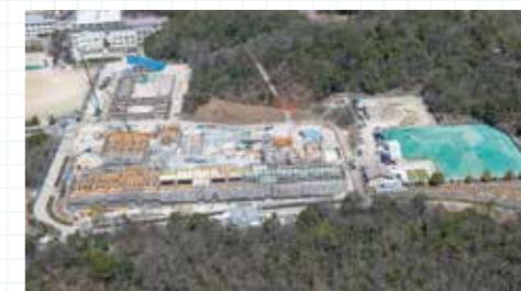
にじの丘学園建設現場(南側上空からの眺望)

昨年6月の着工から、現在順調に工事が進んでいます。地元の皆さんには工事車両の通行などにご理解・ご協力を賜り誠にありがとうございます。今後も安全安心に工事が進捗するよう努めてまいります。