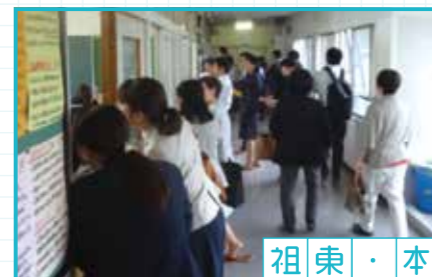
祖東・本山ブロック

深川小、祖母懐小、道泉小、東明小、古瀬戸小、本山中の先生が祖東中の授業の様子を参観しました。