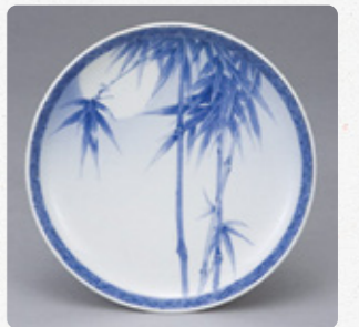
染付竹図皿 伊藤四郎左衛門作 瀬戸市蔵