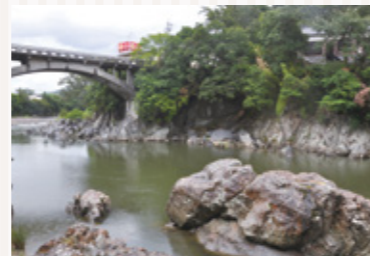
現在の鹿乗橋・鹿乗淵