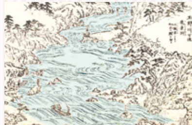
「尾張名所図会」後編の鹿乗淵(一部着色)

瀬戸市の北西端の鹿乗町は、庄内川を挟んで春日井市と接しています。庄内川の古虎溪から定光寺・鹿乗橋付近までは玉野川と呼ばれ、景勝地として知られていました。中でも下流にあたる鹿乗淵近くは、「尾張名所図会」では、「奇岩怪巖多し」「奇岩何れも目を驚かし、魂を奪うばかりなり」と紹介されています。東岸の断崖は要害の地として中世に水野氏の居城であった入尾城でもあり、淵の上流の「入尾の渡し」は水野と春日井諸村とを結ぶ交通の要衝でもありました。明治43(1910)年にはアーチ橋の鹿乗橋が建設され、淵を眺める近くの料亭は、瀬戸の陶磁器商と外来のバイヤーとの商談・接待の場などとして賑わいました。