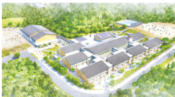
2020年に開校する小中一貫校「にじの丘学園」イメージ図