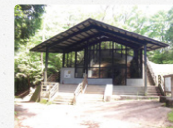
日本遺産 瀬戸窯跡 小長曾陶器窯跡