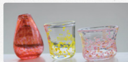
色付きの器イメージ

※作品は、後日着払いでの郵送(別途箱代が必要)または展示棟受付で引き渡しになります。