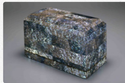
黒田辰秋《耀貝螺鈿飾箱》1974年

東京国立近代美術館工芸館は、昭和52年に開館し、明治期以降の日本と外国の工芸およびデザイン作品約3,800点を収蔵する美術館です。その工芸館の膨大な収蔵品の中から、陶磁・ガラス・漆工・木工・竹工・染織・人形・金工の各分野を代表する珠玉の名品約110点を展示します。