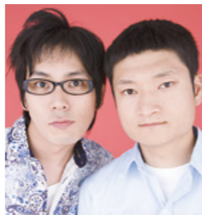
ザブングル(お笑いコンビ)

応募の際いただいた情報は抽選結果のご連絡のほか、受信料のお願いに使用させていただく場合があります。