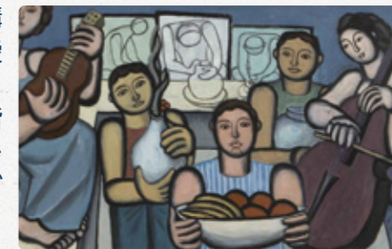
北川民次 市民会館陶壁原画 陶器を作る人々 製陶 1959年

来年度、没後30年を迎えるにあたり、北川民次の全容をとらえるため、皆さんが所有している北川民次の作品調査を行い、その作品を美術館などで紹介する展示会を行いたいと考えています。この趣旨に賛同し作品調査にご協力いただける方を募集します。