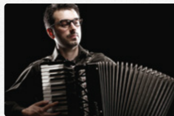
エツィオ・ギバウド

特別展「多彩なる近現代工芸の煌めき」の関連事業として、市美術館でロビーコンサートを開催します。近現代工芸作品の技とともに現代のアコーディオン奏者の多彩な演奏をお楽しみください。