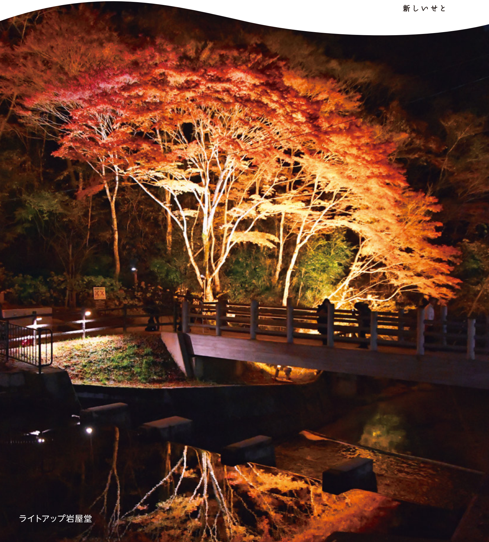
ライトアップ岩屋堂