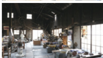
やきもの好きの美知さん。歴史を感じさせる瀬戸の窯にも魅力を感じています。