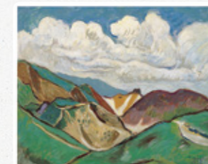
北川民次「八幡平」1957(昭和32)年 65.4×80.7(cm)

国内有数の風景画コレクションである、小杉放菴記念日光美術館所蔵の国立公園絵画を一堂に展覧します。文化勲章受章者12人、文化功労者10人など、名実ともに日本近代洋画界を代表する画家たちが手がけた作品には、それぞれの画家の特徴や制作された時代の雰囲気などがよくあらわれ、日本近代洋画史の流れを辿ることができます。巨匠が描いた絵画を通じて、日本の自然の豊かさや多様性をご覧ください。日本各地の国立公園めぐりをお楽しみください。