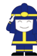
シンボルマーク「ファイ太くん」