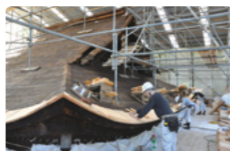
※当日工事は終了しています。

日時／7月29日(土) 午前10時～午後3時 場所／定光寺本堂 参加費／無料 内容／葺替え工事がほぼ終了したこけら屋根を工所用足場から見学できます。 申込方法／事前申込不要です。当日現地へお越しください。 ※見学者多数の場合は入場をお待ちいただく場合もあります。 その他／雨天決行・荒天中止。動きやすい服装でご参加ください。見学の際は、こちらで用意したヘルメットを着用していただきます。