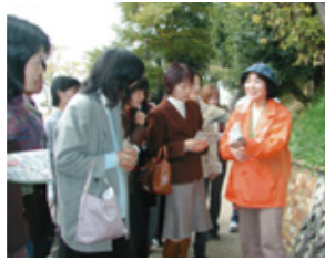
観光ボランティアガイドのようす