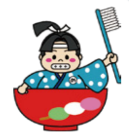
瀬戸市健康応援キャラクター めたぼうし

むし歯、歯周病に気をつけて 妊娠中は唾液がねばねばしてくるので、食べかすが残りやすくなります。またつわりなどで吐きやすくなる上に、すっぱいものを好んで食べることも多くなるので、口の中が普段より酸性に傾きがちです。 つわりの時期は一度にたくさん食べられないので、食生活もついつい不規則になります。そのうえ歯ブラシを口に入れるだけで吐き気がおこり、歯磨きをしたくない時もあります。このように妊娠すると口の中や生活が変化することにより、虫歯や歯周病が起きやすくなるのです。 歯磨きと歯の健診を 虫歯や歯周病を防ぐのに効果的なのは歯磨きです。食べたらずのつど歯を磨くのがよいのですが、できないときは、必ず水で口をゆすいでください。比較的気分のよい時間帯には丁寧に歯磨きをして、口の中の清潔に気をつけてください。 ふだんから定期的に歯の健診を受けるのが理想です。受けていない人は妊娠安定期に入ったら歯科を受診し、必要なら妊娠中に治療をしておきましょう。出産直後は、なかなか受診しにくいものです。 むし歯菌が子どもにうつらないように気をつけてあげましょう むし歯菌は口うつしで食べさせることでうつりやすくなります。スプーンなどを赤ちゃんやお子さんと共用すると、唾液に混じったむし歯菌がスプーンなどを介してお子さんの口うつってしまいます。お父さん、おじいちゃん、おばあちゃんも気をつけましょう。