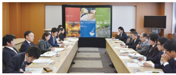
ブランディング戦略推進会議の様子

委員の皆さんからの意見を参考に、瀬戸の魅力再発見、シティプロモーションしていくための「せとまちブランディング戦略」を策定しています。皆さんもぜひSNSなどを活用して「瀬戸の魅力」を多くの人に伝えてください！