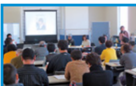
昨年度セミナーの様子