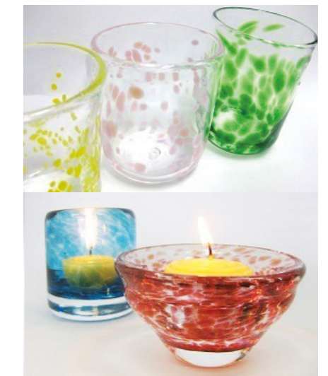
イメージ (上:色つきコップ 下:キャンドルホルダー)

※作品は、後日着払いでの郵送(別途箱代が必要)または展示棟受付で引き渡しになります。