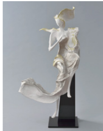
栗本雅子「波の声」2015年 桐塑 高さ85cm