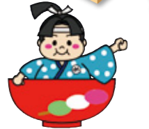
瀬戸市健康応援キャラクターめたぼうし