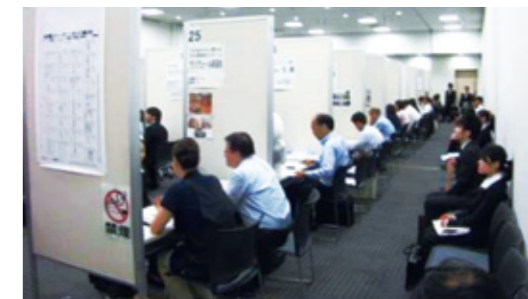
就職フェアのようす

主な参加企業 株式会社イトー急行、株式会社エコペーパーJ.P、株式会社オプトン、株式会社ケーアールアイ、公立陶生病院組合、株式会社波多野耕文堂、富士特殊紙業株式会社、株式会社MARUWA、村井工業株式会社 ほか