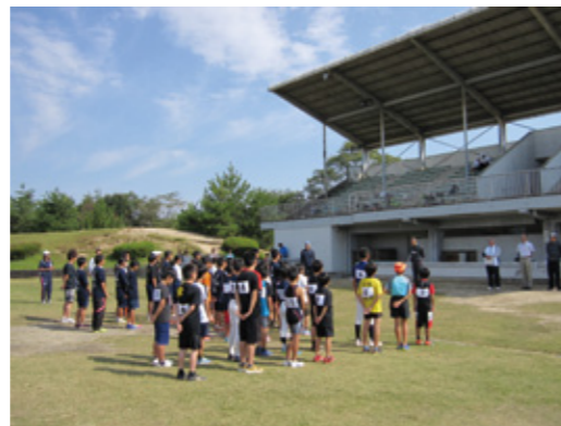
第10回大会 代表選手選考記録会の様子

選考記録会の結果と書類選考により決定します。(9区間18人)小中学生については、記録会の各種目成績上位2人を代表候補者とします。