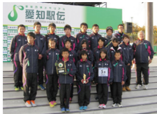
第10回大会 瀬戸市代表チームのみなさん ※昨年は、第8位入賞でした!