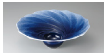
作品写真 大谷昌弘 「銀河」

期間: 9 | 25 日まで 場所: 市美術館 開館時間: 午前9時~午後5時(入館は午後4時30分まで) 休館日: 9月13日(火) 入館料: 一般: 300円、高大生: 200円、中学生以下、妊婦、65歳以上、障害者手帳をお持ちの方は無料 ギャラリートーク(陶磁専攻教員、出品作家による作品解説) 日時: 9月4日(日) 午後1時30分~ 場所: 市美術館展示室 ※事前申込不要、要入館料