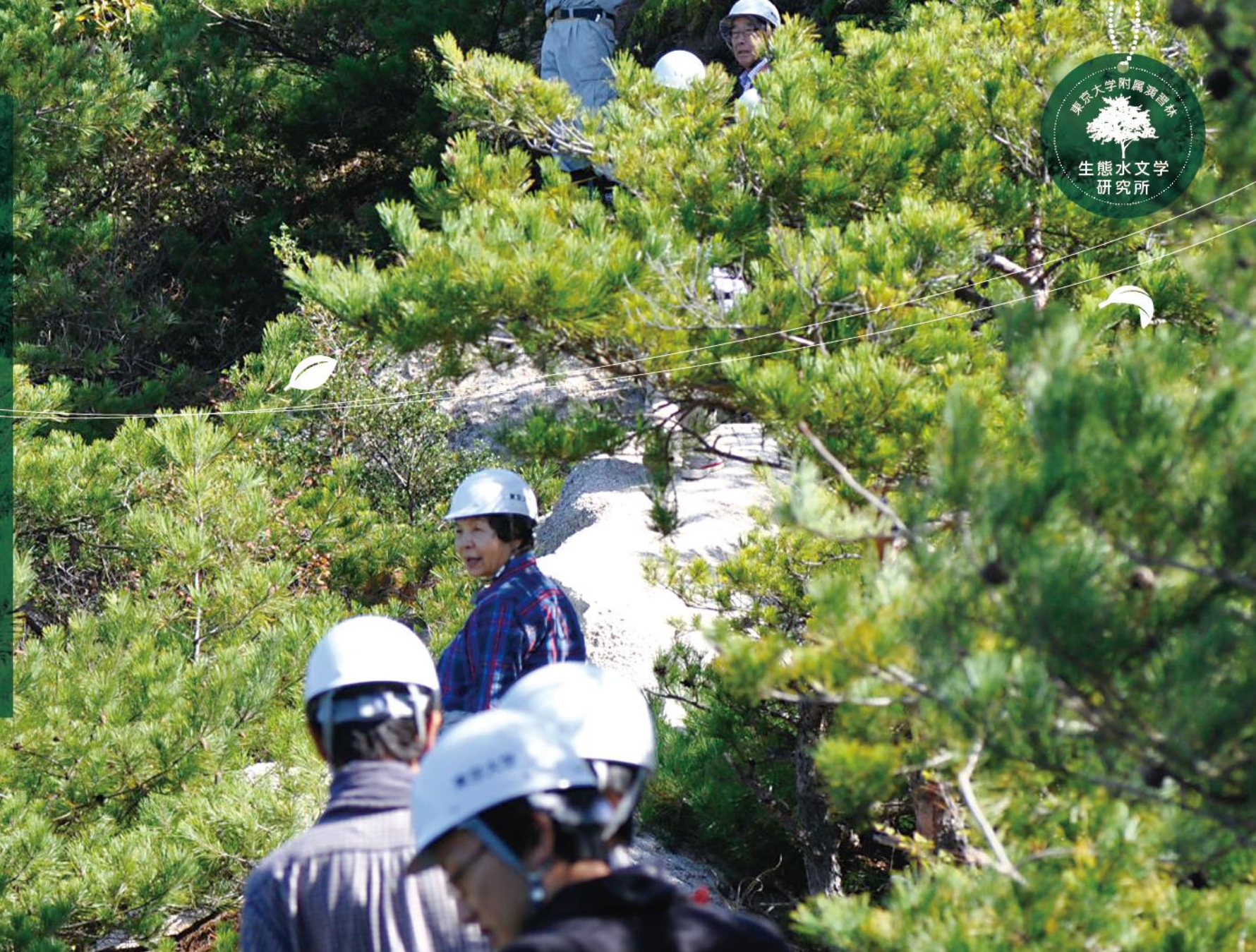
赤津研究林 ハゲ山地帯

東京大学大学院農学生命科学研究科附属演習林(東大演習林)は全国に7か所あり、そのひとつが瀬戸にあります。それが「生態水文学研究所」です。1922(大正11)年に愛知県演習林として設置され、2011年に生態水文学の研究を推進する組織として改称しました。100年近くにおよぶ歴史をもつこの演習林は、私たちの暮らしや産業とも深い関わりがあります。なぜ瀬戸に東大演習林があるのか、どのような取り組みを行っているのか、そしてそこに関わる人々について紹介します。