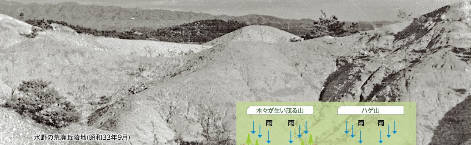
水野の荒廃丘陵地(昭和33年9月)