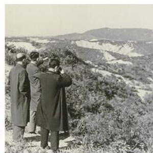
東大演習林時代の水野地区 右奥に東谷山稜線(昭和28年11月)

東大演習林は当初、水野地区や現在の陶生病院を含む瀬戸の市街地まで広がっていましたが、1964年に現在の赤津研究林の一部と交換をしました。