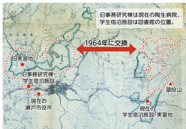
旧事務研究棟は現在の陶生病院、学生宿泊施設は図書館の位置。

そのころ瀬戸では、やきものを焼く薪のために大量の木を使い、周辺一帯の山々がハゲ山となっていました。そのため瀬戸が実習地に最適だと判断され、演習林が設置されました。日本にある大学の演習林のなかで、ハゲ山再生のために設置されたのはここだけです。