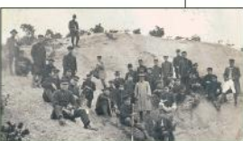
水野での学生実習(大正13年)