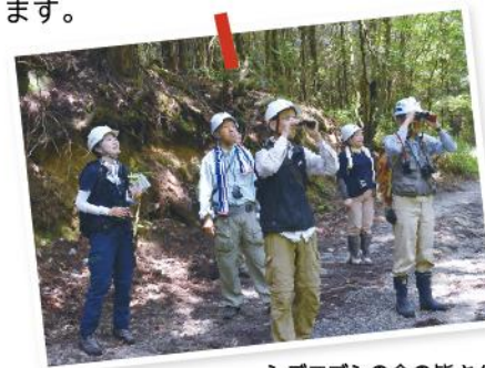
シデコブシの会の皆さん