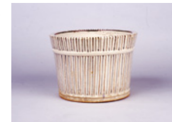
むぎわらてびんかけ 麦藁手瓶掛 19世紀前期 瀬戸市蔵

6|29(水)～9|26(月) 場所:瀬戸染付工芸館 休館日:火曜 入館料:無料 ※染付体験について、くわしくはホームページをご覧ください。 http://www.seto-cul.jp/sometsuke