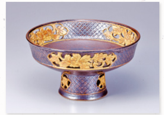
▲加藤士師明 「透彫牡丹文高台鉢」 大正14年(1925)

80周年を記念して、現在の瀬戸陶芸協会会員・準会員の作品を一堂に展示するとともに、瀬戸陶芸の確立に寄与されてきた物故の陶芸家の作品を展示します。瀬戸陶芸の歴史や瀬戸陶芸の今、そして瀬戸陶芸の技と美をご覧ください。