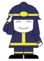
市消防イメージキャラクター ファイ太くん