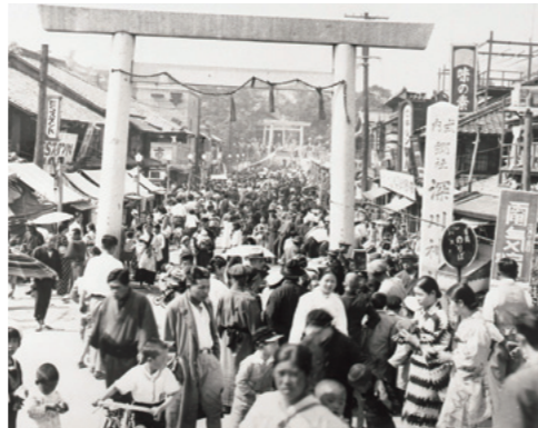
昭和10年頃の深川神社付近

「歴史文化基本構想」とは、市内の地域資源の保存・活用を図り、これらの地域資源を活かしたまちづくりを推進するための基本構想です。