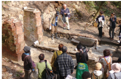
昨年のような(東洞A窯跡)