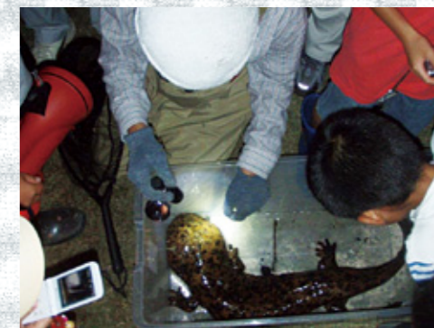
オオサンショウウオ