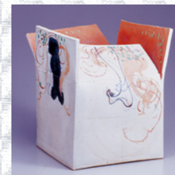
河本五郎「色絵撩乱の箱」1974年