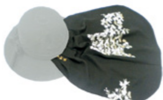
▲日よけ部分を作ります。(帽子は含みません)