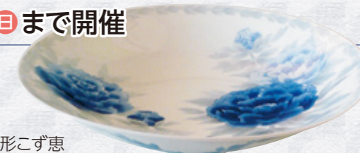
染付牡丹紋鉢 小形こず恵

瀬戸染付研修所を巣立った修了生19人の作品を一堂に展示し、瀬戸染付研修所の軌跡をたどります。