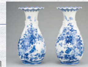
染付花鳥図大花瓶 加藤空左衛門(二代) 19世紀後期