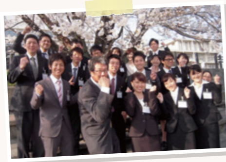
平成26年4月採用職員