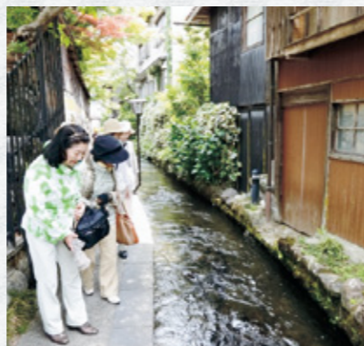
昨年の様子(郡上八幡市)