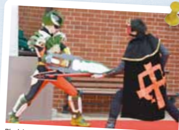
陶神オリバーショー