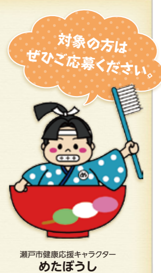
瀬戸市健康応援キャラクター めたぼうし

高齢になっても豊かに楽しく過ごすためには、いつまでも自分の歯で、自分の口から食事をとることが大切です。20本以上の歯があれば、ほとんどの食べ物を噛みくだくことができ、味を楽しみながら食べることができます。健康で長生きをするためにも、8020・8520を目指して歯のお手入れをしっかり行いましょう。