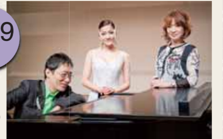
主催:瀬戸市、(公財)瀬戸市文化振興財団、愛知県、(財)自治総合センター

<チケットぴあ購入方法> ※お電話でのご予約後、セブン-イレブン、サークルK・サンクスまたはチケットぴあ店舗での代金の支払いとチケットの引き換えをしてください。(各店舗で直接お買い求めいただくこともできます。) ※チケットぴあでの購入には手数料が必要です。申し込み時にガイダンスのご案内を確認してください。 ※チケットぴあでの購入は先着順で自動配券されますので、座席の指定はできません。 ※お買い上げいただいた入場券は、公演中止以外での交換・払い戻しはできません。