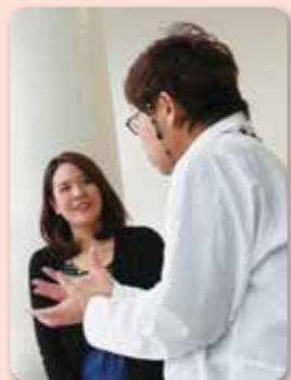
「瀬戸のプライダ」取材の様子