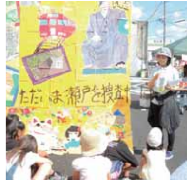
「ガールスカウト愛知県第66団」活動のようす

市を中心に活動する市民活動が対象です。たくさんの市民団体の皆さんの申請をお待ちしています。相談も受け付けていますので、申請をお考えの方は、交流学び課または市民活動センターまでお気軽にご相談ください。