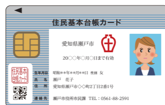
住民基本台帳カード