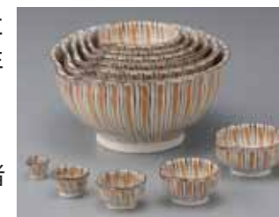
三色麦藁手入子片口 2013年

料 一般300円(240円)、高大生200円(160円)、中学生以下・65歳以上・妊婦・障害者手帳をお持ちの方は無料 ※20人以上の団体は( )内の入館料