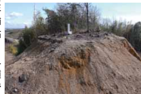
えびす社からみた駒前第3号墳

この古墳は5世紀末に築かれ、6世紀前半に墓前での祭祀がなされました。この直下の幡山西保育園脇には、市指定史跡で前方後円墳の本地大塚古墳が所在し、駒前第1号墳に続く6世紀前半の築造であることがわかっています。駒前第1号墳は、調査後造成され残っていませんが、尾根上方の御鋤神社付近の2号墳、えびす社の奥で石碑の建てられている3号墳は、後世の改変を受けている部分もありますが、現在も残存しています。