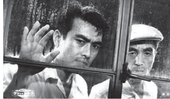
〈1958年 日本/116分〉松竹/白黒