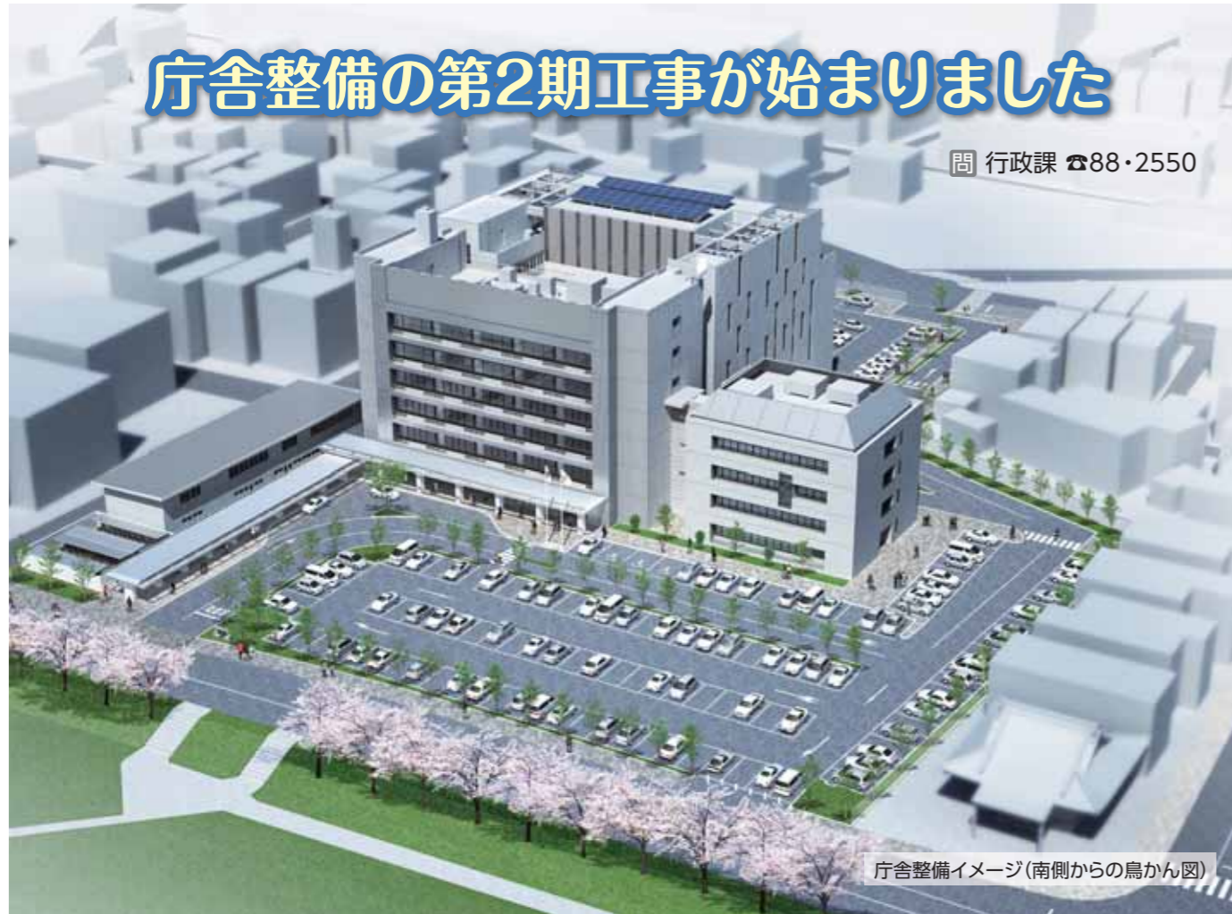
庁舎整備イメージ(南側からの鳥瞰図)