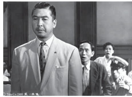
〈1960年 日本/95分〉東宝/白黒