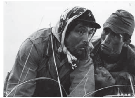
〈1964年 日本/183分〉東映/白黒