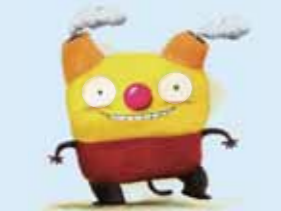
ノベルティ・子ども創造館 シンボルキャラクター 「チムニー」