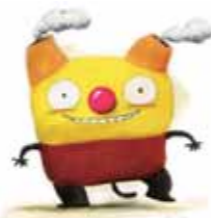
ノベルティ・子ども創造館 シンボルキャラクター「チムニー」