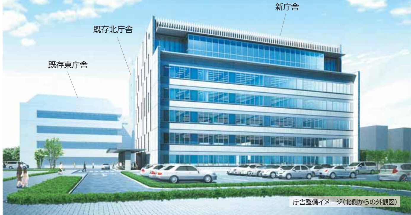
庁舎整備イメージ(北側からの外観図)

東日本大震災を契機に、災害に強い庁舎の整備を緊急の課題として捉え、市議会における議論や市民意見募集、市民説明会などを経て、庁舎整備事業を進めてきました。