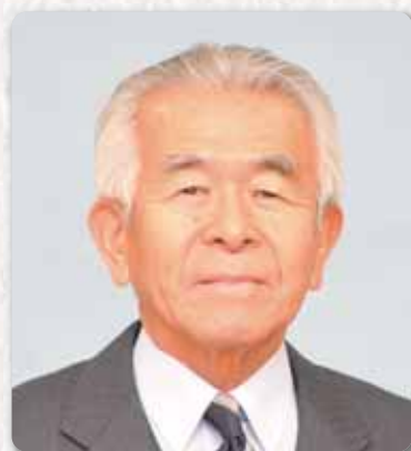
瀬戸市長 増岡 錦也