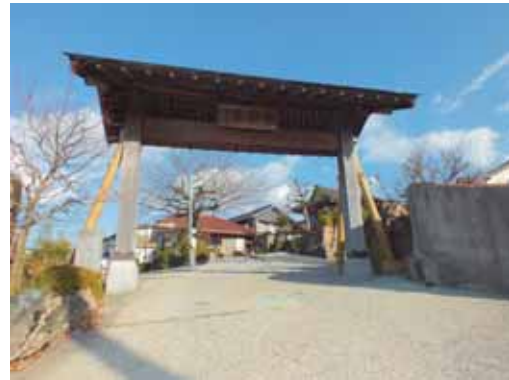
阿弥陀ヶ峰城跡とされる全宝寺

阿弥陀ヶ峰城は、武士の居城ではなく砦としての一時的な軍事拠点であったと考えられ、現在では城郭の遺構は確認できませんが、小高い全宝寺の境内地がその故地と伝えられています。