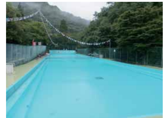
▲閉鎖する岩屋堂公園50mプール

なお、市民公園プール(市民公園内)は、7月7日からオープン予定ですのでご利用ください。