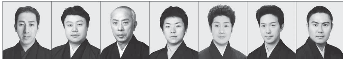
いちかわ 市川 門之助 もんのすけ 市川 猿弥 えんや 市川 寿猿 じゅえん 市川 弘太郎 こうたろう 市川 笑三郎 えみさぶろう 市川 笑也 えみや 市川 右近 うこん