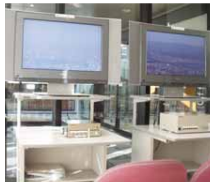
▲ヴァーチャル展望台

タワーに登ることはできませんが、タワーに設置された高所カメラの映像を見ることができる「ヴァーチャル展望台」がタワー隣のデジタルリサーチパークセンターにあります。カメラを自由に遠隔操作しながら、周辺の景色を楽しめます。ぜひお立ち寄りください。