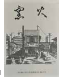
昨年の作品集「窯火」