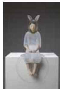
小田橋昌代 [The Entrance to the Inner world II]