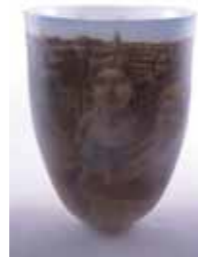
池本一三 [1108 SCENE Riga]