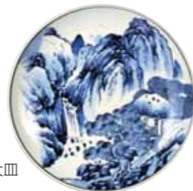
川本半助 染付山水図大皿