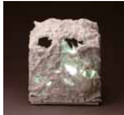
CLAY SPIRIT 2009年

入館料 一般：500円、高大生：300円 中学生以下、心身障害者、妊婦、65歳以上の方は無料 ※どちらの展示もご覧いただけます。