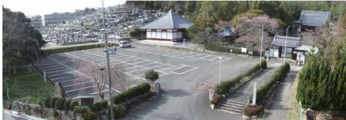
現在の本泉寺(右手奥)に残る土塁(左手の林)

後の1613(慶長18)年には、かつての城跡の地に本泉寺が移動し現在にいたります。本泉寺境内の南側には現在も土塁や堀の名残と考えられる土手や池が存在しています。(下の写真)