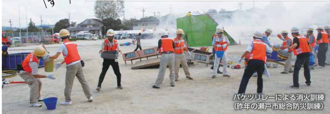
バケツリレーによる消火訓練 (昨年の瀬戸市総合防災訓練)

※震度6強の揺れとは、立っていることができず、固定していない家具は倒れ、ブロック塀のほとんどが崩れる状況を示します。