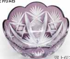
河上伝次郎 鉢 昭和前期