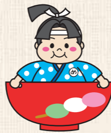
瀬戸市健康応援キャラクター めたぼうし