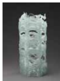
スティック ウェイブ 4 2012年 高さ48cm

入館料 一般:500円、高大生:300円 中学生以下、心身障害者、妊婦、65歳以上の方 は無料 ※どちらの展示もご覧いただけます。