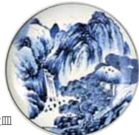
川本半助 染付山水図大皿