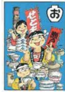
おまつりで とうじきならば 瀬戸の町