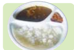
瀬戸豚やわらか 500円 煮込みカレー