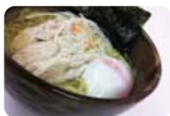
名古屋コーチン 680円 ラーメン