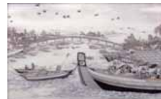
上絵川遊び図磁板