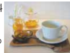
※写真は昨年のもので