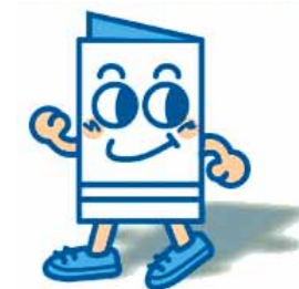
イッピョウくん 愛知県選挙管理委員会の啓発キャラクター