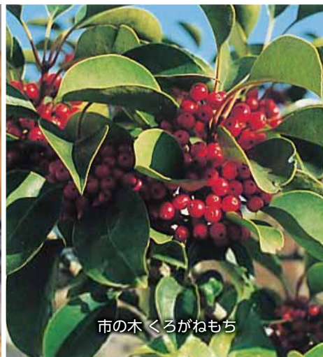
市の木 くるがねもち