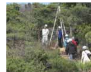
講座④自然・座学&ツアー