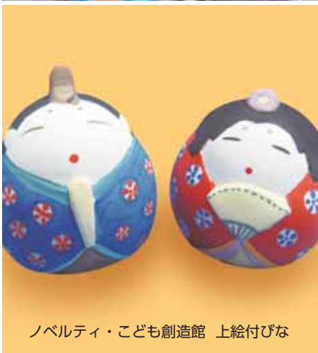
ノベルティ・こども創造館 上絵付びな