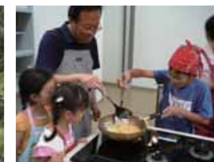
親子講座③食・体験 ごはんでエコ!