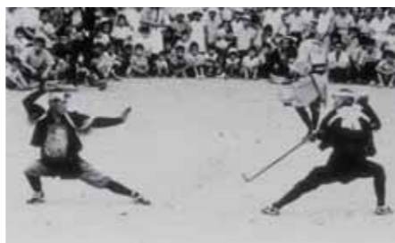
棒の手(山口の警固祭り)

棒の手は、棒・鎌・薙刀などを用いた武術の民俗芸能ですが、オマント奉納の行列を警固するかたちで、火縄銃の鉄砲隊とともに馬の塔(オマント)の祭礼と結び付く例は多く、市指定文化財「山口の警固祭り」「菱野のおでく警固祭り」「本地警固祭り」などが今日まで伝えられています。