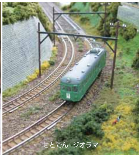
せとでん ジオラマ