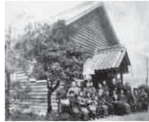
大正4年頃の礼拝堂

市内には、国・県・市の指定した文化財が71件、国の登録した文化財が2件あります。今回は、今年4月に、国の文化財として登録された、瀬戸永泉教会の「礼拝堂」を紹介します。