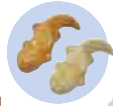
おおさんしょうお

「文化財」とは聞きなれない言葉かもしれませんが、歴史的・芸術的に価値のあるものを、次の世代に伝えるために、大切に保護しているもので、昔からの建物や絵画、彫刻をはじめ、やきものなどの工芸品や、遺跡などの埋蔵文化財、動物・植物などの天然記念物などが対象となります。 瀬戸のまちにも多くの「文化財」があり、皆さんの身近な所にあったりします。もうすぐ、夏休みになります。まちの宝「文化財」を家族やお友達と見に出かけませんか。