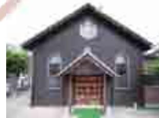
せとせいせんきょうかい