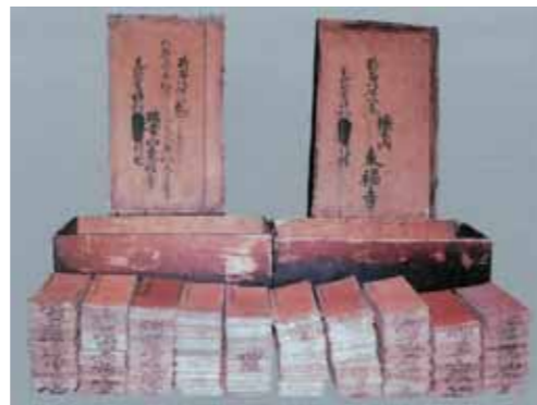
「大般若経」とその収納箱