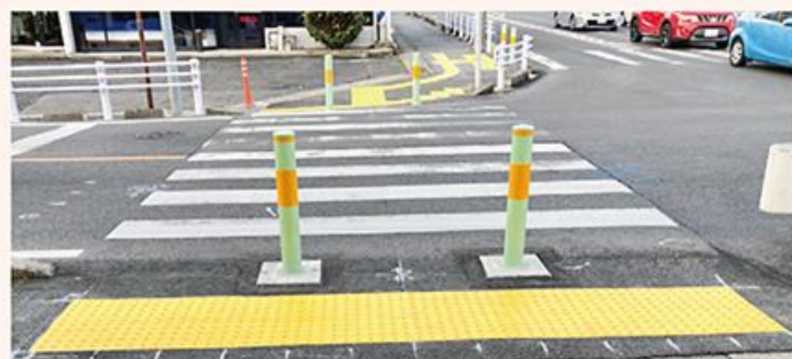
水南町交差点(南西角から北西角を望む)

A バリアフリー新法に基づき、障害者の方々と意見交換しながら進める。今後は水野駅周辺・山口駅周辺の交差点を予定している。