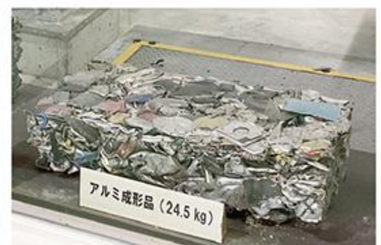
小牧岩倉エコルセンターのようす