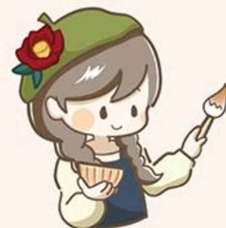
市ホームページのチャットボット

A 全庁的に案内を出して集約するという従来の方法から、全課共有のデータベースを活用した方法に切り替え、迅速な回答の充実に努めている。