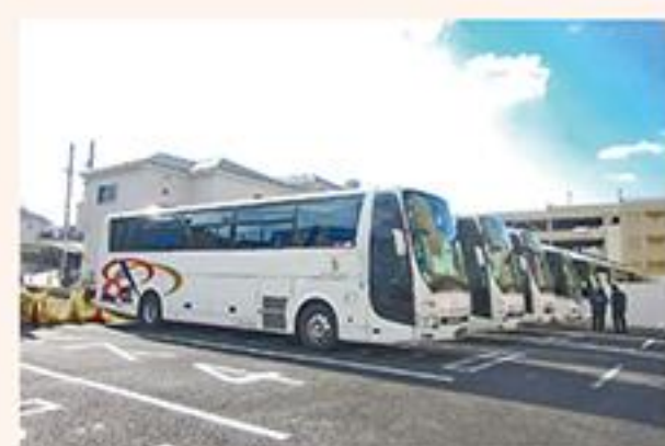
瀬戸蔵のバスツアーの様子

A バスツアーは、キャンセルが続いたが、令和3年11月から1ヶ月で、約1,000名のツアー客にお越しいただいた。各旅行会社に過去最高の200ツアーを企画いただいている。次年度以降も、尽力していく。