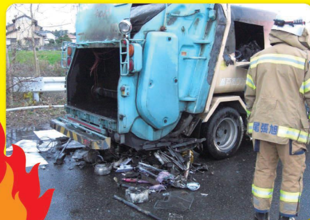
収集車で火災が起きた様子