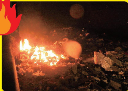
晴丘センターで火災が起きた様子