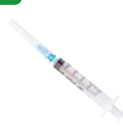
プラスチック製の 注射針