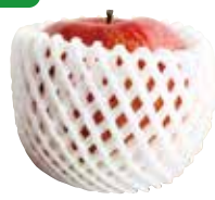
果物ネット (発泡スチロールのもの)