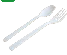
プラスチック製の スプーン・フォーク