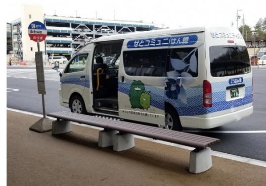
コミュニティバスのりば