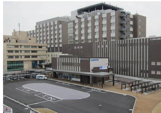
バスロータリー（全景）