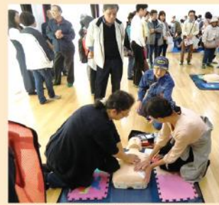
救命救急訓練(AED操作)

令和元年10月27日(日)に地域力推進協議会と自治会が一体となり新郷連区防災訓練を開催しました。地域内の「安全・安心なまち」をモットーに緊急避難所に指定された瀬戸西高校の生徒や先生、地域の中学生も参加した地域全員参加の訓練です。町内・組での避難行動訓練、住人の安否確認訓練などを行うとともに身の安全を守る主旨のもと、1部(町内・組内・自宅)2部(交流センター敷地内)構成にて行い、シェイクアウト訓練、初期消火訓練、救命救急訓練などを体験していただきました。訓練終了後には豚汁、非常食の試食が行われ、好評のうちに終了しました。新郷地域内の「住みやすいまち」を目指して、安否確認を重視した防災訓練を今後も継続実施していく考えです。