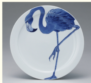
染付皿「フラミンゴ」 小枝真人