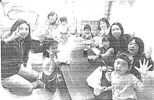
ちゃぶ台を囲んでお話をする「親子のひろば」参加者のみなさん(12頁)