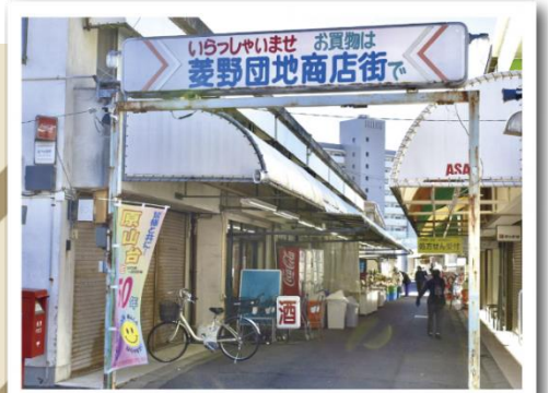
笑顔で元気な美容店。女性顔そり好評です。毎月4回サービスデー。