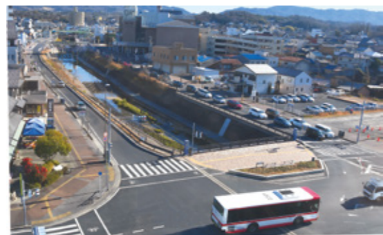
瀬戸川プロムナード線