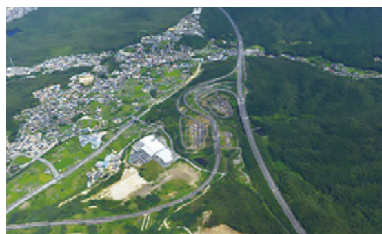
東海環状自動車道せと赤津IC