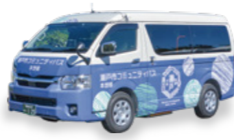
コミュニティバス

将来像の実現に向けて、未来のまちの姿としての3つの都市像を掲げています。都市像は、瀬戸市の現状と課題を踏まえて達成を目指す目標であり、将来像を実現するための具体的な都市の姿です。