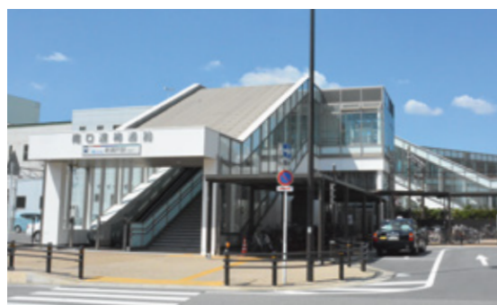
新瀬戸駅連絡通路

瀬戸市は、市域の中央を流れる瀬戸川に沿って市街地が形成され、尾張地方の中心的な都市の一つとして発展してきました。現在、名鉄瀬戸線が名古屋市内とを結び、愛知環状鉄道がJR中央線高蔵寺駅と、豊田市内を経由しJR東海道本線岡崎駅とを結んでいます。また、東海環状自動車道の二つのインターチェンジを有し、日本の物流や移動の大動脈である東名・新東名高速道路や中央自動車道などにつながっています。こうした広域的な移動を可能とする利便性を活用し、企業活力の増進と観光交流を促進します。 市域の鉄道駅などの交通結節点を中心拠点・地域拠点と位置付け、子育て、医療・福祉、商業などの都市機能と居住機能を集積・再配置し、暮らしの質を高める拠点の形成を図るとともに、それぞれの拠点が有する機能を有機的に連携する交通ネットワークを構築することにより、コンパクトでまとまりのあるまちづくりを進めます。