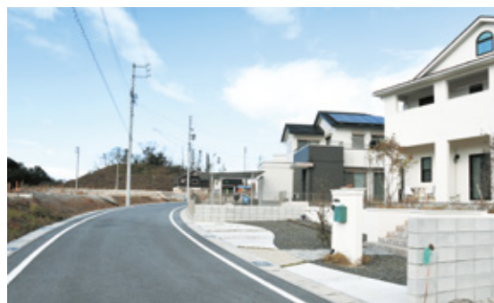
塩草区画整理事業