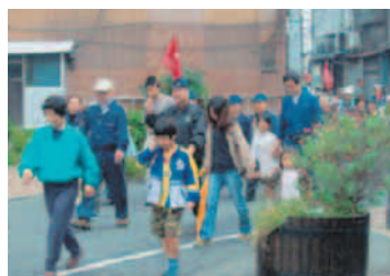
④避難訓練への参加