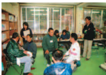
③健康に関する相談