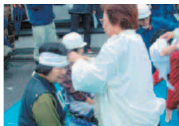
②負傷者への応急手当