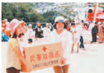
①被災者への救援物資の配布