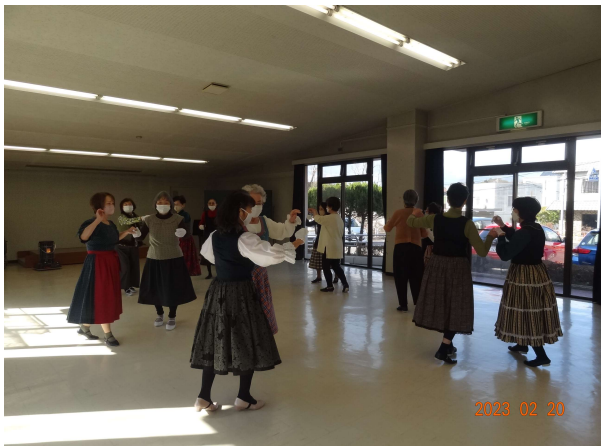
東明フォークダンスクラブ