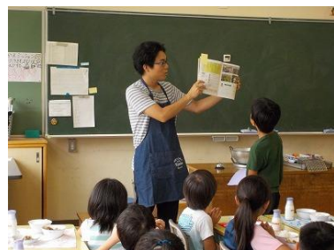
【なすを紹介する担任】

毎年7月と9月は、給食に矢正農園でとれたなすを使用しています。今年度7月は、中学校と掛川小学校で「夏野菜カレー」、小学校（掛川小学校を除く）と特別支援学校で「瀬戸市産なす入りマーボー豆腐」を提供し、給食の時間や昼の放送等で紹介しました。小学校での様子をお知らせします。