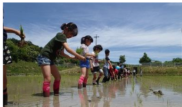
【田植えをする子どもたち】

瀬戸市では、15年以上前から、幡山地区の矢正農園で収穫された農作物を給食に使用し、地産地消に取り組んできました。平成25年度にはプロジェクトチームが設置され、農業に関する取組が進められています。現在は、「アグリカルチャー推進係」が地産地消の推進や農業の担い手の育成などに力を入れています。さらに、地域の農家や学校と連携し、米作りや収穫体験なども行っています。