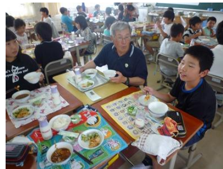
【農家の方との会食】

収穫した玉ねぎが市内の給食で使用された日には、お世話になった方々を招待し、一緒に給食を食べました。玉ねぎは、「瀬戸市産たまねぎと大豆のかき揚げ」に使われました。揚げ物にすることで、玉ねぎの甘味が引き立ち、とてもおいしいかき揚げになりました。子どもたちは、農業について話を聞き、楽しい時間を過ごしました。農家の方は、「残さず食べてくれて、嬉しい」と喜んでくださいました。