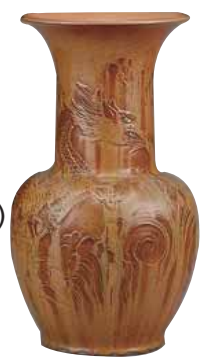
結晶釉大花瓶 高島徳松