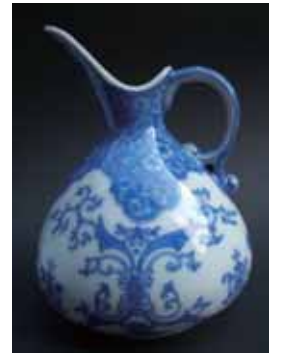
染付花唐草文水差 加藤周兵衛作 明治時代前期