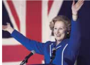
© 2011 Pathe Productions Limited, Channel Four Television Corporation and The British Film Institute.

1979年、父の教えである質素儉約を掲げる保守党のマーガレット・サッチャーが女性初のイギリス首相となる。“鉄の女”の異名を取るサッチャーは、財政赤字を解決し、フォークランド紛争に勝利し、国民から絶大な支持を得ていた。しかし、彼女には誰にも見せていない孤独な別の顔が……。