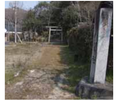
入尾城跡内に所在する八幡社

東西32間(約58m)、南北31間(約56m)の周囲に堀を廻らせたとされる入尾城跡ですが、現在は城域の北西端にあたる部分に八幡社が所在するのみとなっています。