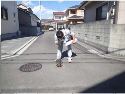
調査イメージ（道路上）