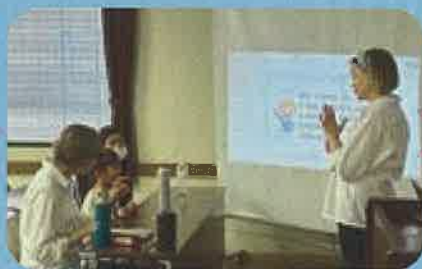
②アクティビティー